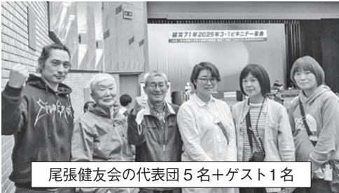
尾張健友会の代表団 5名+ゲスト1名

尾張健友会 草の根活動は小さなひとしづくでも 2月28日、3月1日の二日間、平和研修に参加させて頂きました。 一日目は東京にある①第五福竜丸展示館、②アクティブ・ミュージアム「女