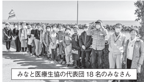
みなと医療生協の代表団 18名のみなさん

尾張健友会 草の根活動は小さなひとしづくでも 2月28日、3月1日の二日間、平和研修に参加させて頂きました。 一日目は東京にある①第五福竜丸展示館、②アクティブ・ミュージアム「女