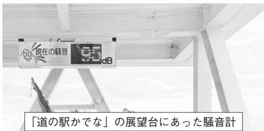
「道の駅かでな」の展望台にあった騒音計

辺野古新基地工事ゲート前では、国の代執行による工事再開直後であったため抗議集会が開催されてきました。北海道の学生など若い世代が平和への思いを語っている姿が印象的でした。