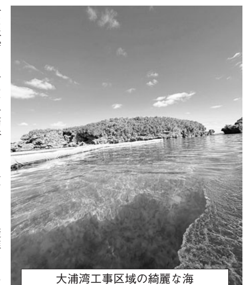
大浦湾工事区域の綺麗な海