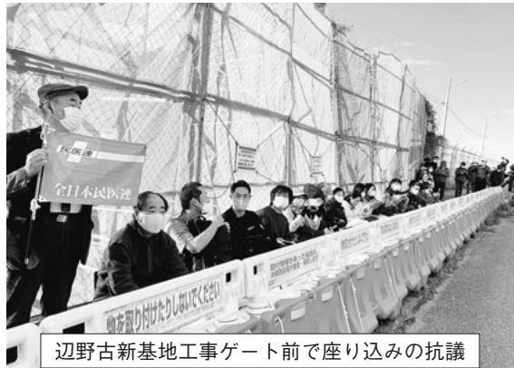
辺野古新基地工事ゲート前で座り込みの抗議