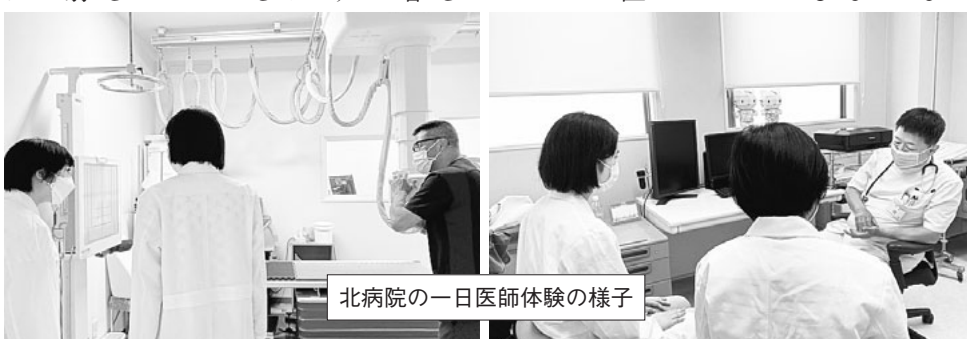
北病院の一日医師体験の様子

そして、診察室での診療見学の際には、医師からも患者さんのことや医療について語ってくださっています。廊下ですれ違ったりハピリスタップは「楽しんでいてね!」、看護師長からも、「初々しいね!」と声をかけてくださり、学生さんも私も嬉しくなりました。