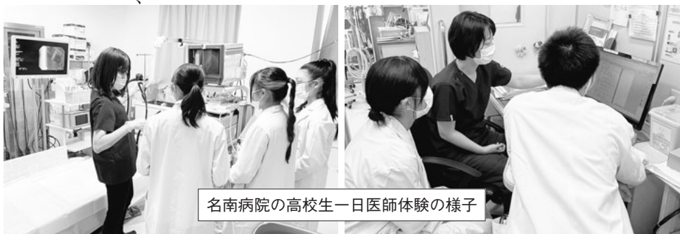
名南病院の高校生一日医師体験の様子

参加者からは「名南病院のように幅広く患者全体を診ることの重要性を感じました」、「内科カンファレンスがとても印象に残りました。一人の患者を複数の医師がどうアプローチしていくか話し合っていた、凄く格好良かったです」、「患者さんと直接話せて、医師になりたい気持ちが高まりました」との感想が出されました。