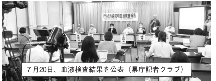
7月20日、血液検査結果を公表(県庁記者クラブ)

7月20日、血液検査結果に関する記者発表が県庁記者クラブで行われ、京都大学・原田准教授、同大学・小泉名譽教授が結果を報告