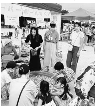
7月31日、8月1日に行われた「平和盆踊り」に

カンパ活動は、職員を対象にしたカレーや炊き込みご飯セットの販売、患者さんやご家族に訴え待合室にバザーコーナーを設置しました。多くの方から未使用の日用品などが多く寄せられ、ペットボトルお茶50本の差入れもありました。