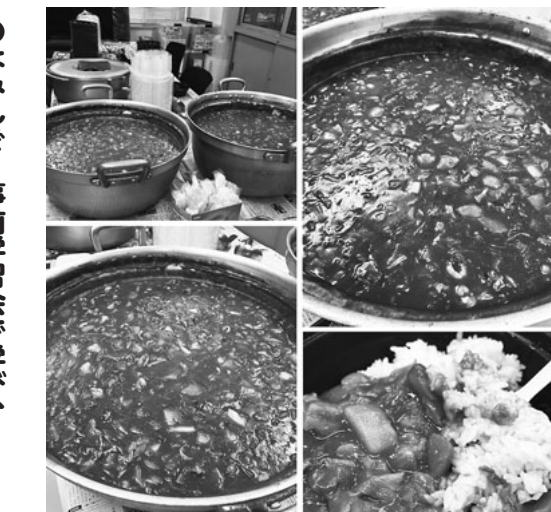
名南会は原水禁反核カレーで財政活動。174食完売しました