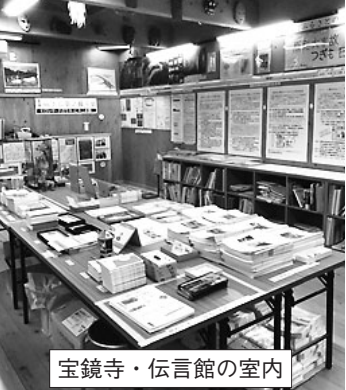
宝鏡寺・伝言館の室内

計は毎時2マイクロシーベルトから20マイクロシーベルト位まで跳ね上がりました。(愛知の平常で0.02マイクロシーベルト)バスを降り直に見学すると、この場所は高線量のたため作業時間が制限されているとのこと。建屋内の瓦礫撤去は、まだまだ先が見えません。線量計が1000マイクロシーベルト近くまで出ていたため、短時間でバスに戻ることとなりました。その後、海沿いに建設中のALPS処理水放出施設を見て事務棟に戻りました。外部被曝チェックの後、東電との座談会がありました。