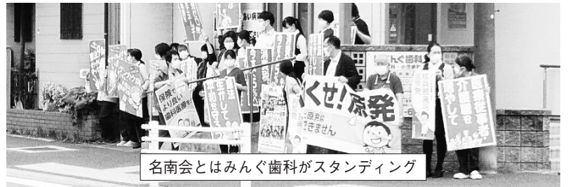
名南会とはみんぐ歯科がスタンディング

たくさんの フラカード、 横断幕を掲げて、 21人でアピール 4月19日、ふれあい病院社保平和委員会とはみんぐは、合同のとりくみとして、まちかどスタンディングをはみんぐ歯科前で行いました。 総勢21名が参加し、「なくせ原発」「核兵器廃絶」「憲法生かして平和を守るう」「消費税いまずぐ5%へ」などのプラスター、横断幕を掲げて元気よく道行く方々にアピールしました。