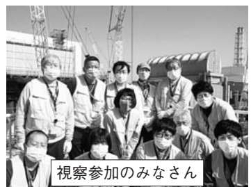
視察参加のみなさん

ALPS処理水の海洋放出を「安全」とする科学的根拠として数字が並べられませんが、(いや、まてまて！福島県民や漁業に携わっている人等の気持ちを無視しすぎでしょうか?)と感じるような疑問だらけの回答ばかりでした。福島民医連の方との懇談で、補償による地域の分断がすごく切実な問題になっていることを聞き、只々悲しい現実と感じました。