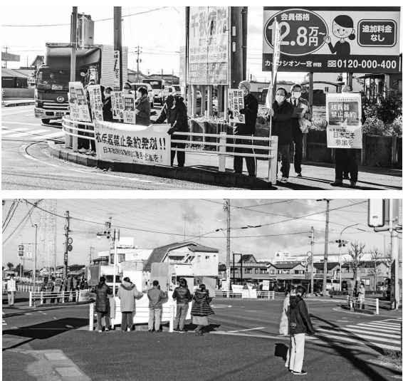
千秋病院近くの元小山交差点で宣伝・上も同じ

尾張健友会は、1月21日に、千秋病院玄関前と元小山交差点にて、尾張健友会グループ職員38名と友の会7名の参加で、核兵器禁止条約1年スタンディング行動を行いました。日本政府はいますぐ核兵器禁止条約に参加を!と訴えたボードを手に大いにアピールしました。通りゆく方の中には、クラクションを鳴らしたり手を振って応援してくださる方もみえました。